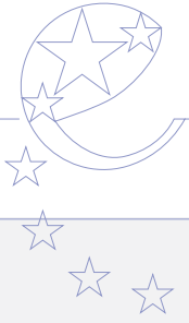
Exemple d'utilisation du logo :