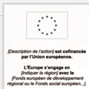
Maquette d'une plaque métallique gravée :